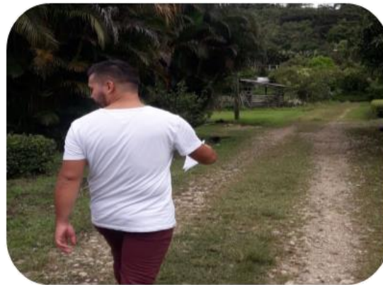
Visita casa por casa