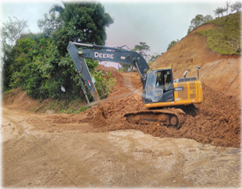
Santa Clara - Torre Alta