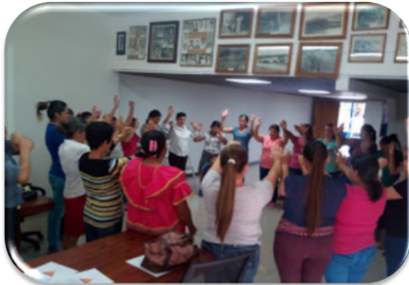
Talleres Cocinera y Cuidadores Casas de la Alegría