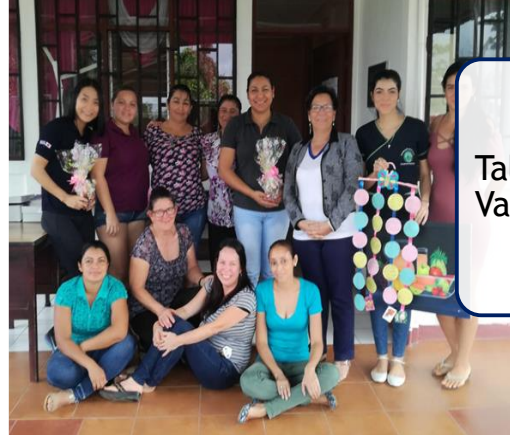
Talleres en Valle Azú