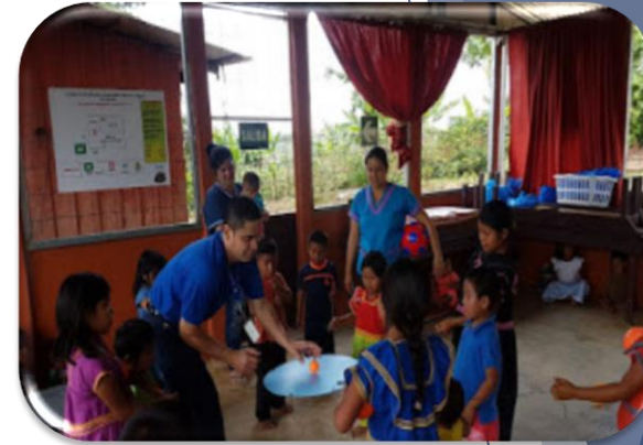
Casas de la Alegría