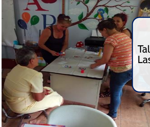
Talleres en Las Juntas