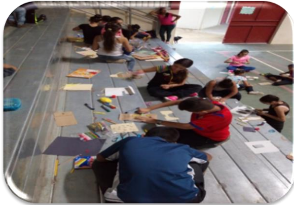
Charlas sobre autoestima, valores, emociones y trabajo en equipo