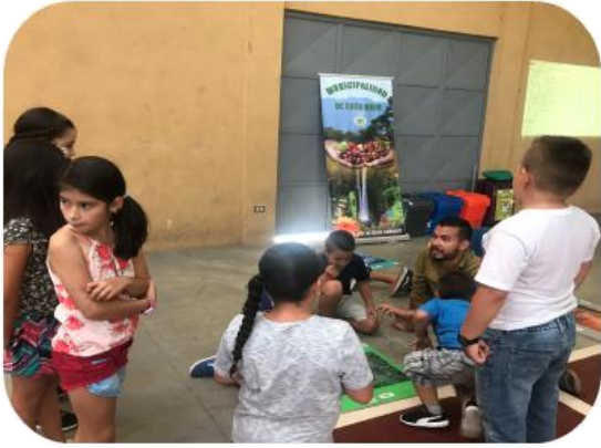
Taller de manejo de residuos solidos feria comunal