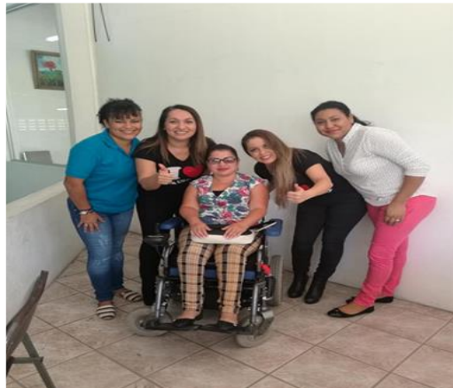
Día Internacional de la Mujer