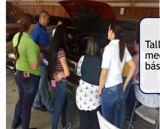
Taller mecánica básica