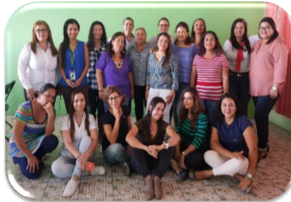
Fortalecimiento de Políticas públicas para la Prevención de la Violencia de Genero de los Gobiernos locales