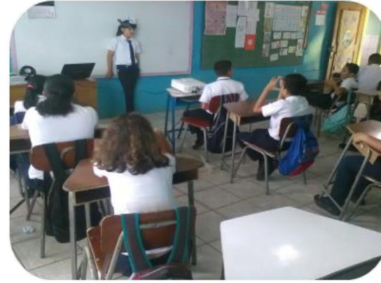
Taller manejo de residuos solidos en la Escuela