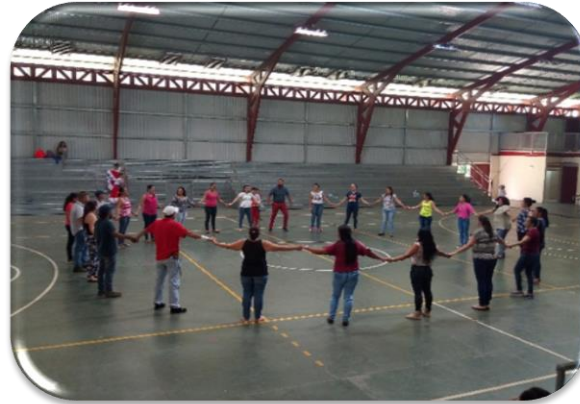
Taller sobre autoestima para padres