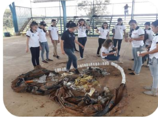
Taller manejo de residuos solidos en el Colegio