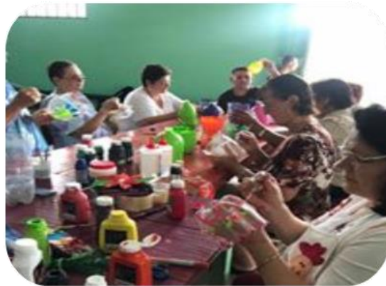
Reutilización de residuos taller grupo adulto mayor